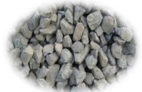
石炭灰混合材料 (ORクリート)