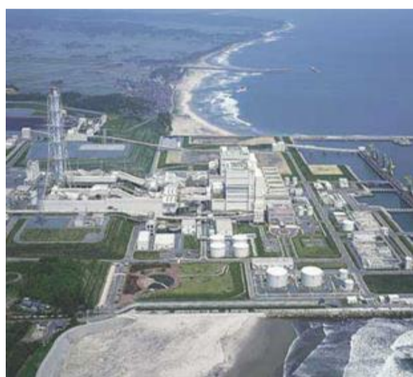
石炭火力発電所 Coal Fired Power Plant