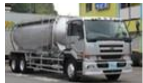
石炭灰 Fly ash (フライアッシュ)