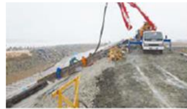
復興工事施工箇所