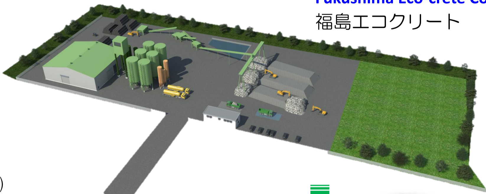
Fukushima Eco-crete Co., Ltd. 福島エコクリート