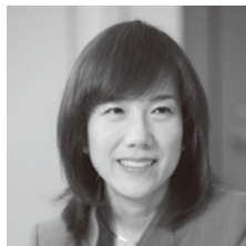
サイエンス・ジャーナリスト 筑紫大学社会学類非常勤講師